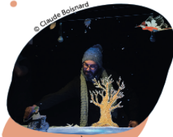
© Claude Bolnard CHAVANNES-PRÈS-RENNES Salle de la Planta, avenue de la Concorde 1

Durée 40' • Théâtre d'objets et musique • Sans paroles • Tarif unique CHF 12.- (CarteCulture CHF 8.-)