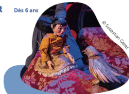
© FRAKT Cie PRILLY Aula du Collège de l'Union, chemin de l'Union 1

Durée 65' • Marionnettes • Tarif unique CHF 12.- (CarteCulture CHF 8.-)