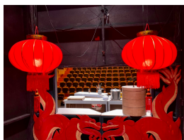
Le rossignol et l'empereur

La scène de la salle de Chisaz à Crissier étant trop haute pour le jeune public, le régisseur de ZIGZAG a recréé un théâtre dans le théâtre en installant le spectacle au pied de la scène avec une nouvelle boîte noire. Le gril, qui permet de suspendre les lumières au-dessus de la scène, a été déplacé et une barre ajoutée pour suspendre une machine à neige. Un très gros coût pour ZIGZAG qui prend entièrement en charge les frais techniques des salles, par contre un spectacle qui reste gravé dans les mémoires.