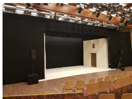
La grande neige

ZIGZAG a fait face à deux gros défis au niveau de la programmation théâtrale : la programmation en préachat du spectacle La grande neige qui s'est avéré être un spectacle pour les grandes salles d'accueil, et la reprise du très spectaculaire Le rossignol et l'empereur .